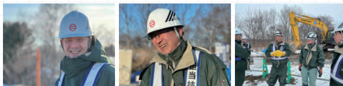
和やかな雰囲気が漂う現場の様子

周囲と信頼関係を築くためにも、現場のためにも、代理人の自分は、常に誠意をもって取り組む姿勢を忘れてはいけないと思っています。