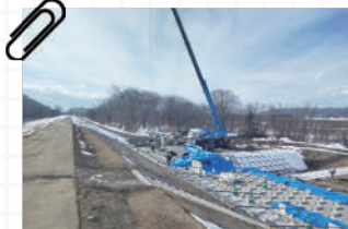
西帯広樋門地区 施工中の様子