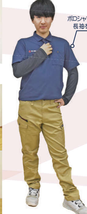
ポロシャツの中に長袖を着用