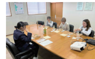
📷 ランチ座談会の様子