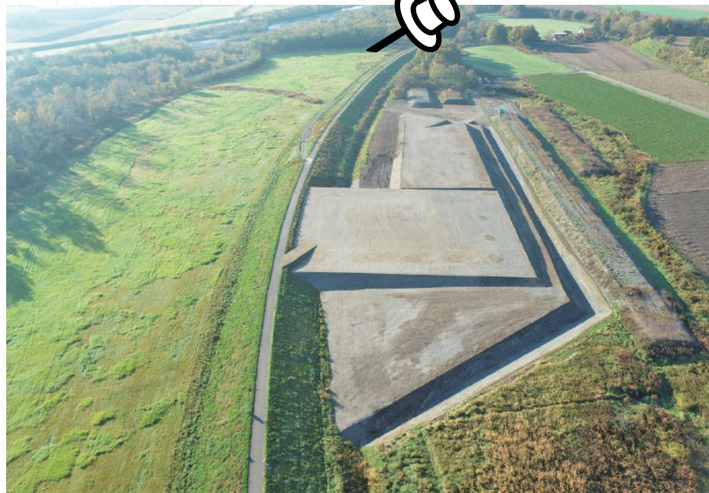
施工完了後の人舞築堤地区

地区での舗装工、西帯広樋門地区での かんきよ 函渠※2工の4工区で施工を行いました。中札内築堤地区では、盛土のためにダンプでの土砂運搬を行っており、運搬路を土砂で汚損しないよう、土砂積み込み・荷下ろし直後に必ず荷台周りの清掃を行うよう徹底しました。