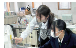
📷 昨年入社した先輩（左）も頼もしい社員になりました