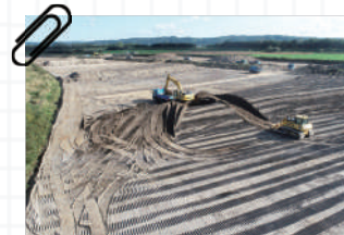
中札内築堤地区（土取場） 施工中の様子