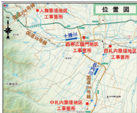
点在する施工箇所

各現場に設置している休憩所で事務作業を行うことで、現場と事務所間の移動時間を削減。施工方法を的確に把握した職員を各工区に配置することで、工程管理をしっかりとしながら施工を進められました。