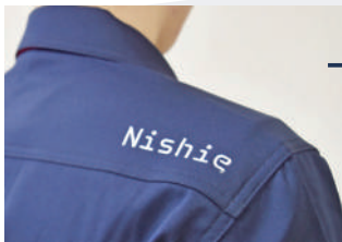
右肩部分にも社名の刺繍入り。さりげないオリジナリティが光る！