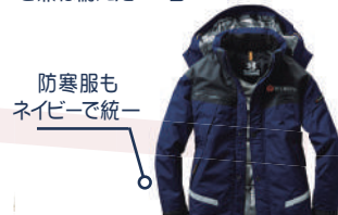
防寒服もネイビーで統一