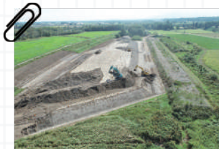
人舞築堤地区 施工中の様子