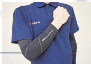
夏の紫外線対策にアームカバーを着用現場で働く職員の大切な味方。