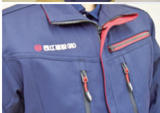
スマホ・野帳もすっぽり収納できるポケット付き。機能性・伸縮性ともに◎