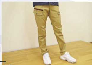
動きやすさ◎ストレッチの効くパンツ