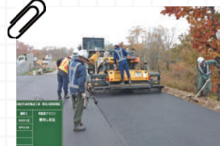
西札内築堤地区 施工中の様子